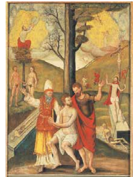
Sidefløj fra Endelave Kirkes alter

I det seneste halve år er naturen vendt tilbage. På godt og ondt. Som et vilkår, der både rummer velsignelse og forbandelse. Vi har genopdaget den danske natur som et mål for aktiv ferie, og markerne velsigner os her til høst med de afgrøder, vi ikke kan undvære. Men de seneste måneder har lært os – hvis vi skulle have glemt det – at naturen også er farlig, dødsensfarlig. Ligesom den velsigner og giver liv, er naturen også meget ofte skyld i livets ophør.